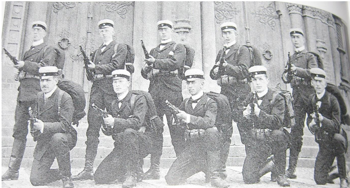
Skaradjäknar 1902 vid skolmästerskapen i Stockholm

Eftersom det ingick i djäknarnas undervisning att hantera gevär bildades också tidigt en skytteförening och skolan hade egen skjutbana. Föreningens medlemmar vann årligen stora framgångar i skolungdomarnas tävlingar i Stockholm.