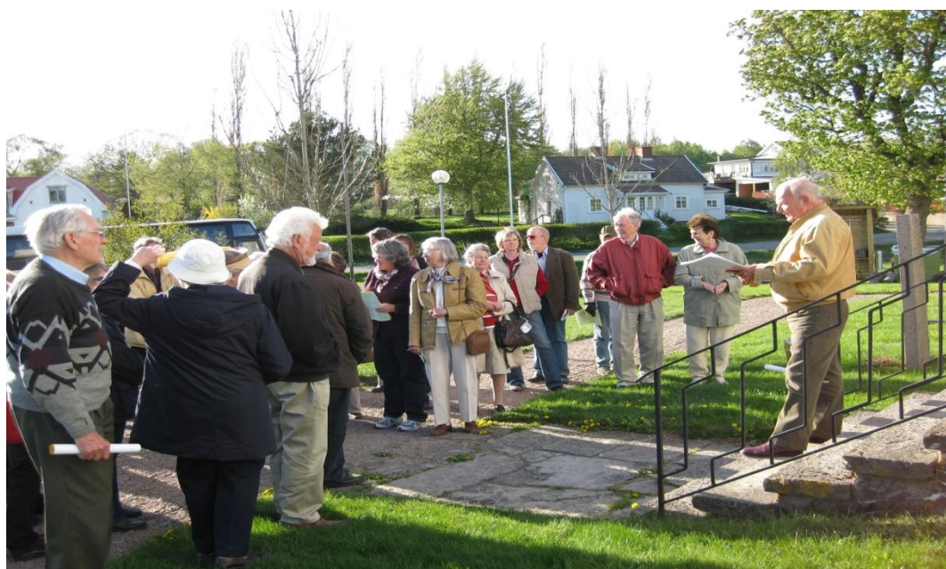
Vid Skärvs kyrka 2010