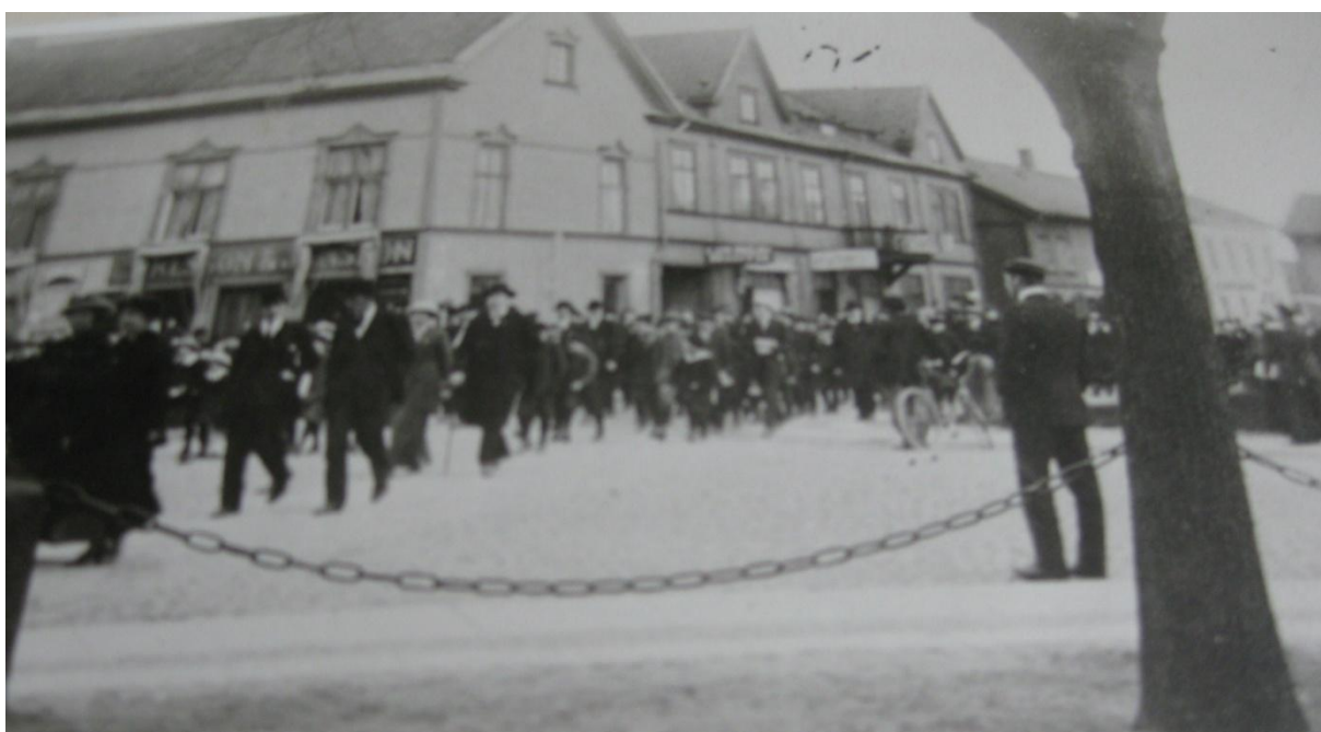
Skarabor utanför Berggrens salong 1:a maj, på väg att lyssna till sång och musik

Bilden nedan är tagen från läroverkets gård, nordvästra hörnet