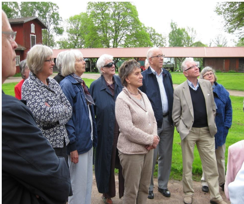
Utmarsch vid Höjentorp 2010

Nutidens djäkna i föreningen har fortsatt traditionen med utmarsch men då på våren – dock med buss.