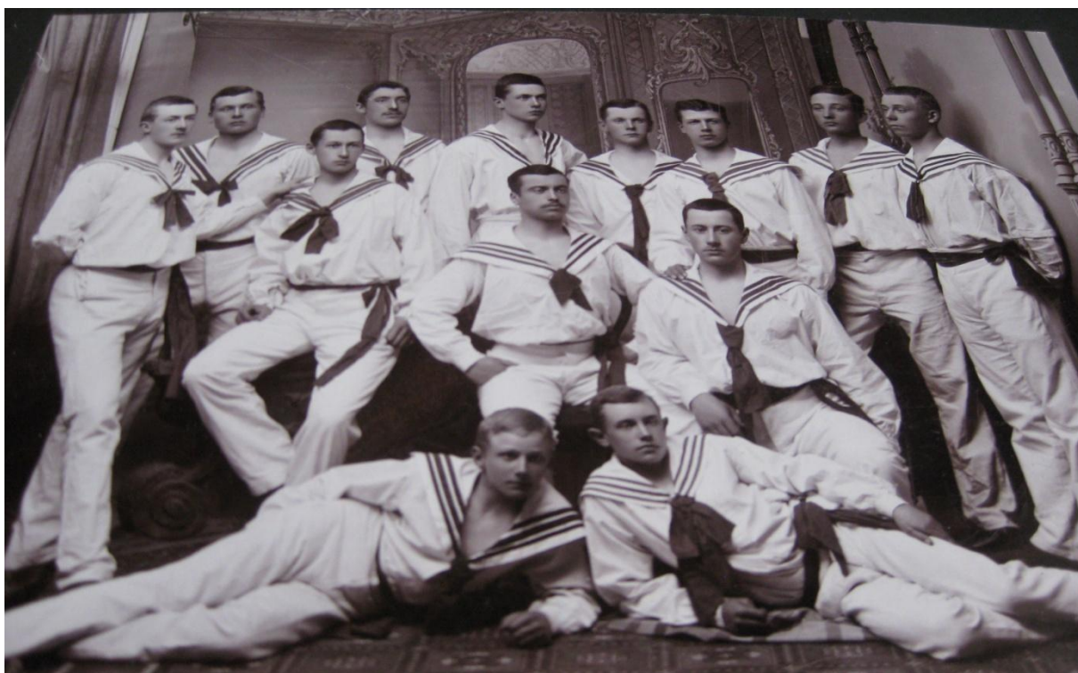
Djäknar från de övre årskurserna