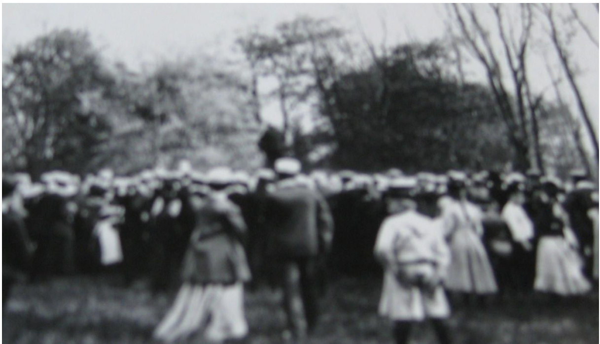
Lekar i Botan