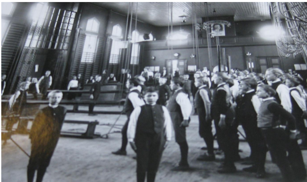
Penor - d. v. s. de yngre eleverna i gymnastiksalen